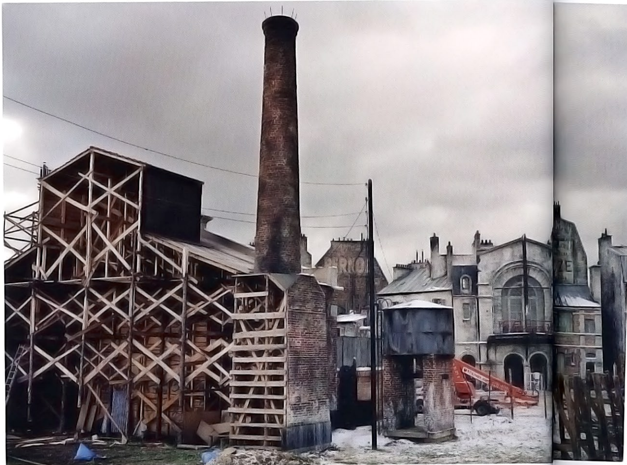
Prague, 60 x 100 cm, 50 x 75 cm, 33 x 50 cm