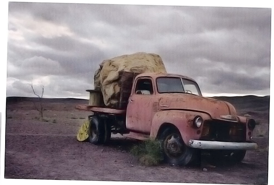
Désert de Ouarzazate, 60 x 100 cm, 50 x 75 cm, 33 x 50 cm